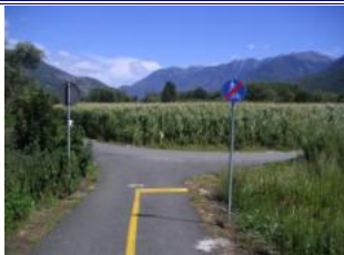
hier links halten