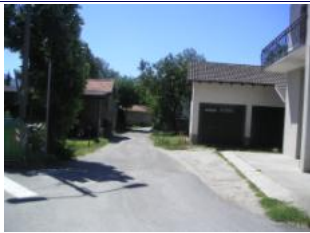
nach ca. 400m rechts abbiegen

Länge ca. 42 km .Start bei der „Ponte del Passo“, Parkplatz links der Straße (v on Gravedona kommend). Die Hauptstraße vomParkplatz her überqueren Richtung Piano di Spagna. . Am Restaurant die Straße links vorbei wählen