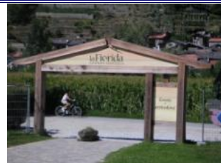
beim A gritourismo „la Fiorida“ lässt es sich bei einem Eis oder einer Brotzeit gut ausruhen