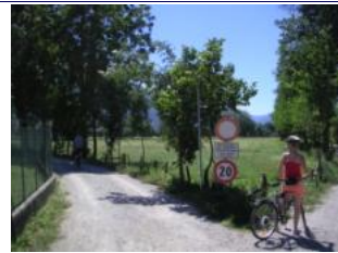
hier links abbiegen