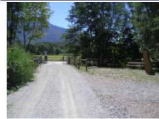
nach der Brücke links abbiegen