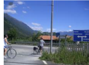
rechts abbiegen, über die Auto-brücke über die Ad da fahren