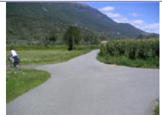
hier links abbiegen