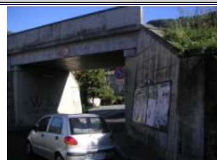
durch die Eisenbahnunterführung fahren