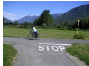
nach 50m wird der Radweg sichtbar, -> links fahren