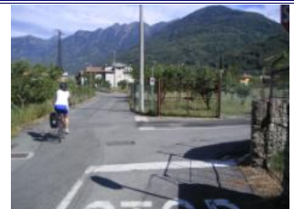
an der Einmündung mit dem rostigen Tor links halten