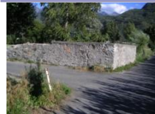
an dem Mäuerchen links abbiegen