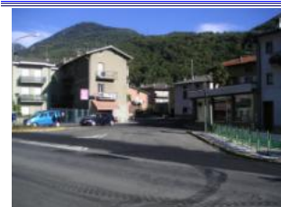
geradeaus über die Kreuzung nach der Unterführung fahren, halblinks (nicht links in die Hauptstraße) fahren