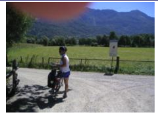
hier links abbiegen