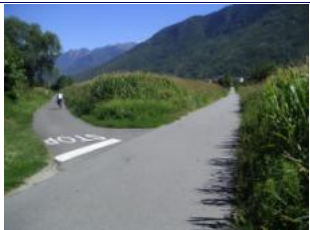
nach 50m wird der Radweg sichtbar, -> links fahren