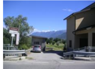
hier links abbiegen, ACHTUNG: SCHOTTERWEG