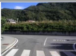
auf der Straße durch Regoledo fahren und vor den Gleisen links abbiegen