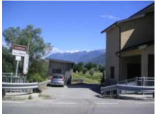
hier rechts abbiegen