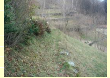
Ab Brunnen „Fontana“ Variante Saumweg oberhalb Dorf Gaggio